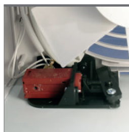
Actionneur thermique pour l'ouverture électrique des ailettes