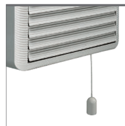
Version avec ouverture manuelle (interrupteur à cordelette)