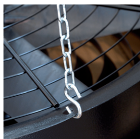
Catene per l'applicazione a soffitto